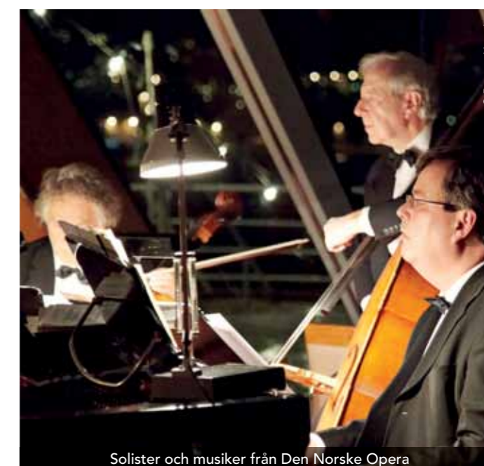
Solister och musiker från Den Norske Opera