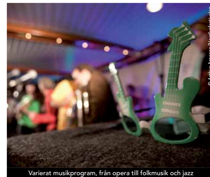
Variert musikprogram, från opera till folkmusik och jazz