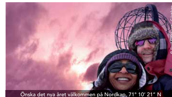
Önska det nya året välkommen på Nordkap, 71° 10' 21" N

Följ med på det här fantastiska nyårsfirandet som du kommer att minnas resten av livet, och följ med oss när båten fortsätter på sin ordinarie rutt efter uppehållet på Nordkap.