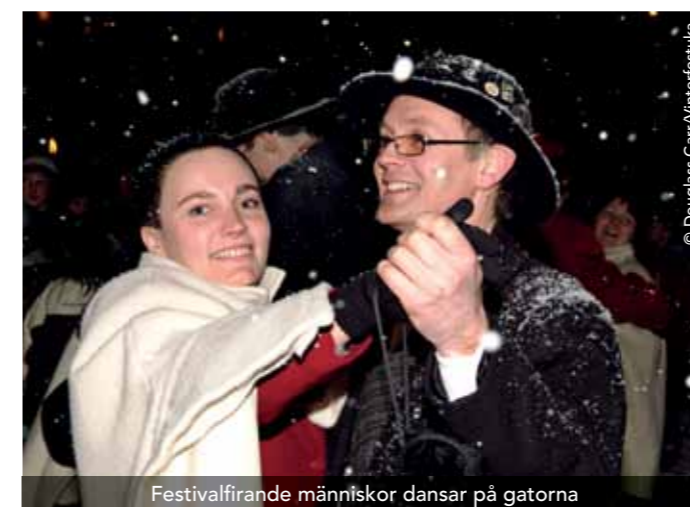
Festivalfirande människor dansar på gatorna