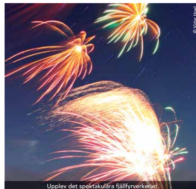
Upplev det spektakulära fjällfyrvärkeriet