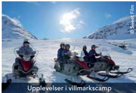
Upplevelser i villmarkscamp