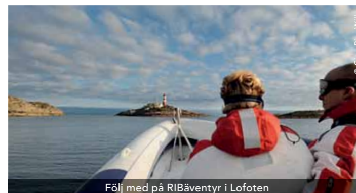
Följ med på RIBäventyr i Lofoten