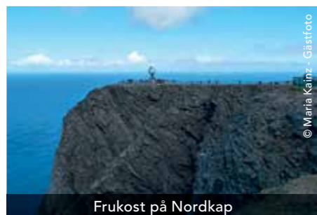
Frukost på Nordkap