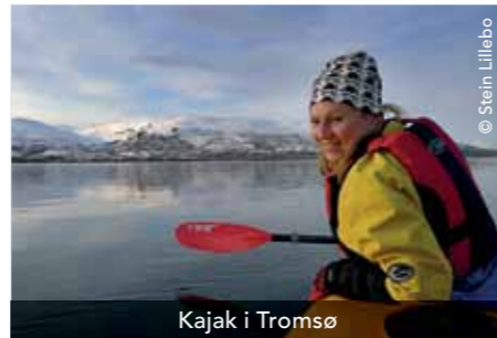
Kajak i Tromsø