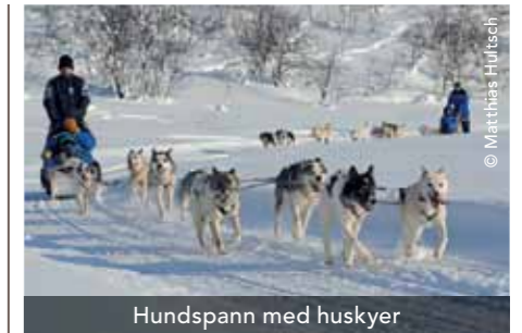
Hundspann med huskyer