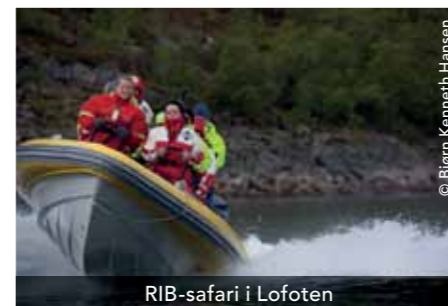
RIB-safari i Lofoten