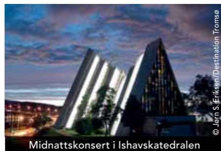
Midnattskonsert i Ishavskatedralen