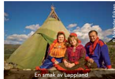
En smak av Lappland