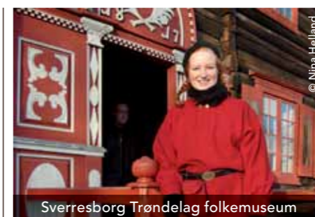
Sverresborg Trøndelag folkemuseum

Välkommen till ett av Norges största friluftsmuseer, Sverresborg Trøndelag Folkemuseum. Museet ligger vid ruinerna av medeltidsborgen Sion, byggd av kung Sverre 1182-83. Vi börjar den historiska vandringen i Haldalen stavkyrka från 1170 då Norge ännu var ett katolskt land. Turen går vidare förbi medeltidsborgens ruiner, med vidsträckt utsikt över Trondheimsfjorden