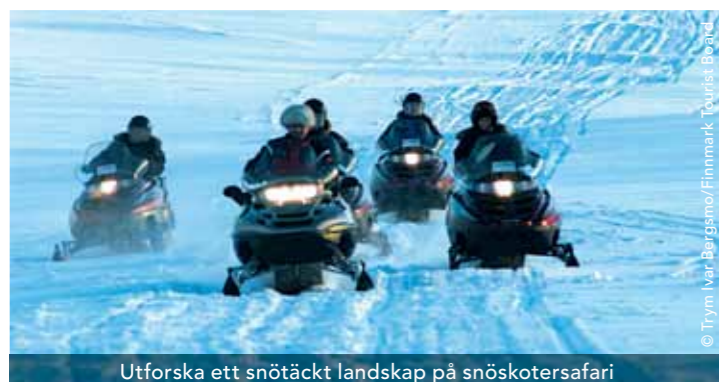
Utforska ett snötäckt landskap på snöskotersafari

Se havets konung, havsörnen, på nära håll