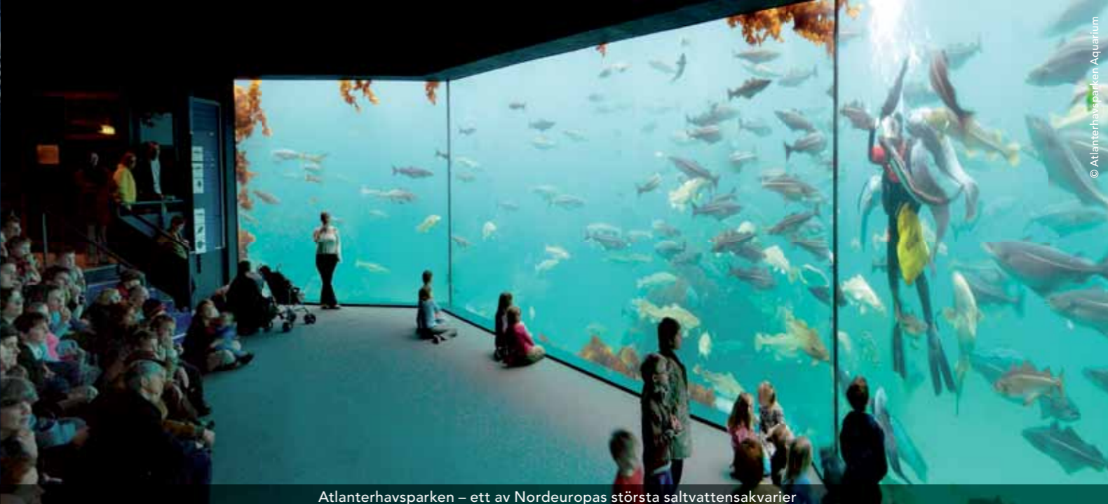
Atlanterhavsparken – ett av Nordeuropas största saltvattensakvarier

Få storstäder har lyckats bevara sin charm så väl som Trondheim, Norges tredje största stad. Trondheim grundades av vikingakungen Olav Tryggvason år 997. Under utflykten stiftar vi bekantskap med två av stadens främsta sevär- digheter. Först besöker vi nationalhelgedomen Nidarosdomen, Norges enda katedral i ny- gotisk stil, rest över Olav den Heliges grav med början runt år 1070. Låt dig imponeras av den otroliga detaljrikedomen och det fantastiska konstverket. Därefter går färden till Ringve Musikhistoriska museum, omgärdat av en botanisk trädgård med enastående utsikt över staden och fjorden. Museets guider spelar alla instrument och tar oss med på en spännande musikalisk resa genom historien med hjälp av instrument från alla världens hörn.