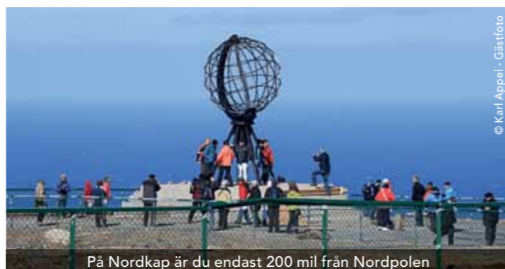
På Nordkap är du endast 200 mil från Nordpolen